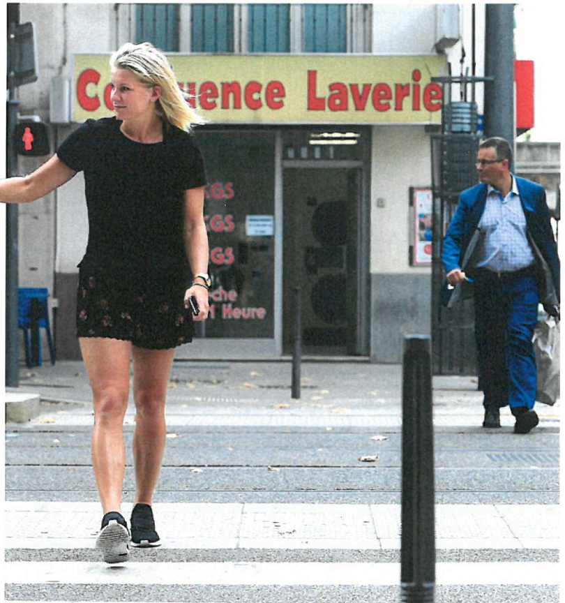
Ada Hegerbergs varsko om at noe er galt i kvinnelandslaget fortjener å bli tatt alvorlig.

Jeg kan hente eksempler fra de beste trenerne jeg har opplevd på mer eller mindre nært hold. Marit Breiviks fantastiske trenerkarriere var basert på involvering og medansvar. Hun kjørte prosjekter som ga alle eierskap. I tillegg tok hun inn de viktigste spillerne og snakket ekstra med dem. Det var gjerne