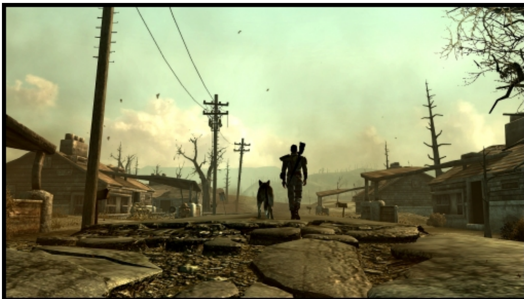
Hunden din Dogmeat er en koselig kompanjong, den er også en rimelig habil kamphund som er god og ha i de fleste kamper

Man ser godt på teksturene i spillet at det er Oblivion teamet til Bethesda som har jobbet med det. Hulene i Fallout 3 har en distinktiv likhet med hulene i Oblivion. Hvordan fiendene blir sterkere etter hvert som du går opp i level er også kopiert fra Oblivion. Jeg savner litt den frykten man får av å gå i soner der du vet fienden er mye sterkere enn deg, og følelsen av makaber glede man får av og endelig klare og drepe de!