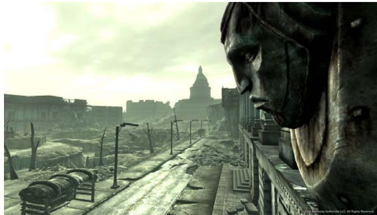
Washington D. C. anno 2277, 200 år etter krigen. Ødemarken har aldri sett bedre ut

Du starter spillet i din egen mors øyne og føder deg selv på en veldig freudiansk måte. Som liten baby må du velge ut dine "S.P.E.C.I.A.L." kjennetegn, deretter er du 10 år og får din egen Pip-Boy 3000 et hjelpemiddel som er uvurderlig i den ødemarken som er et post-apokalyptisk USA. Denne hjelper deg med alt fra kart til lommelykt og radio. Den har integrert V.A.T.S. eller Vault-Tec Assisted Targeting System som gjør det mulig og stoppe intense kamper med noen av ødemarkens mange farer og den hjelper deg med og finne ut hvilken kroppsdel det er størst prosentvis sjanse for og treffe. Etter fylte 19 år forsvinner faren din og du er hovedmistenkt i forsvinningsaken. Du blir tvunget til og rømme velv 101.